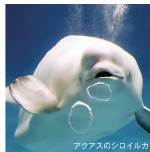
アクアスのシロイルカ