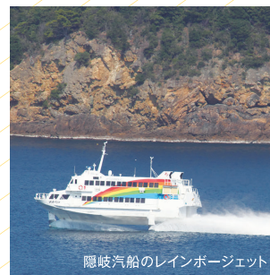
隠岐汽船のレインボージェット