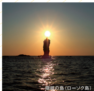
隠岐の島(ローソク島)